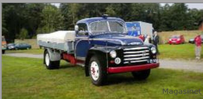
Magasinet Bus 2-2 - 2015