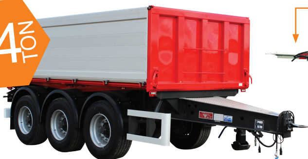
KEL-BERG 3 AKS. TIPKÆRRE 3-VEJS TIP