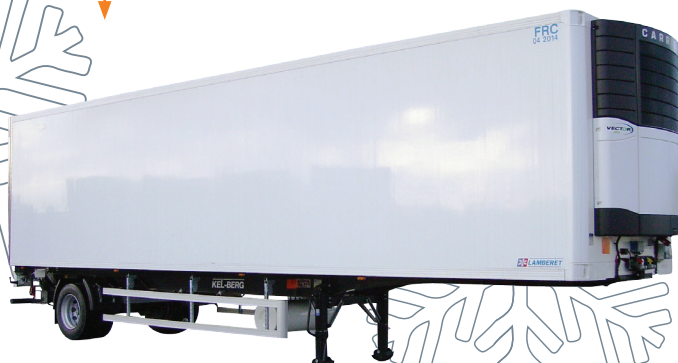
KEL-BERG 1 AKS. KØLETRAILER