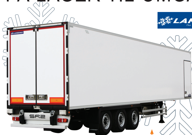
KEL-BERG 3 AKS. KØLETRAILER