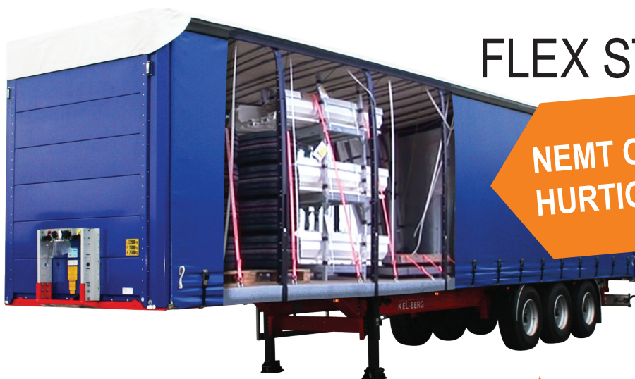
KEL-BERG 3 AKS. GARDINTRAILER